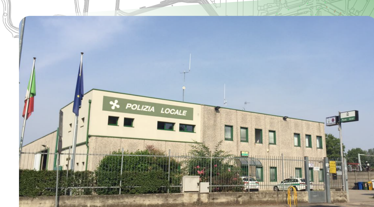
POLIZIA LOCALE CENTRO DI CONTROLLO OPERATIVO DEL SISTEMA DI VIDEOSORVEGLIANZA